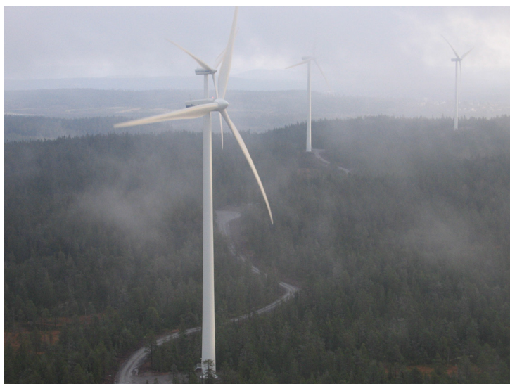
Vindkraftpark Fjällberget, Dalarnas Län